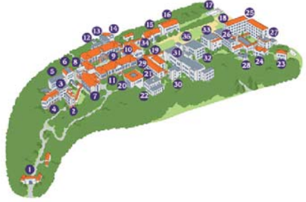
Names of the Buildings

The southern Mediterranean style buildings with ivory colored walls and bronze-colored tile roofs were reputed to be the most magnificent in the country. Moreover, the main, original buildings managed to withstand the Great Hanshin-Awaji Earthquake of 1995 with far less damage than many recently built structures.